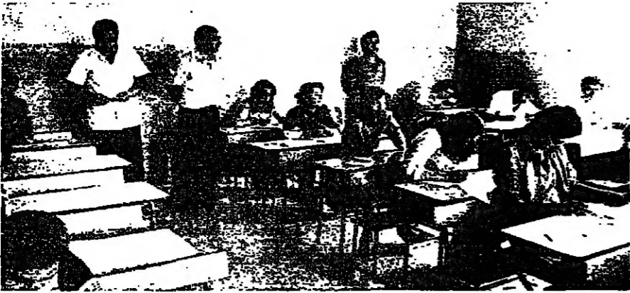
المتبارون والمتبارون والإمتحان